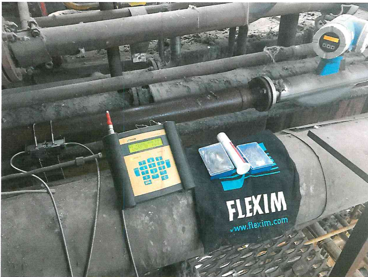
Рисунок 2. Подключение к расходомеру и сравнение показаний